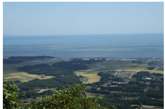
「浦となった新地町沿岸部」