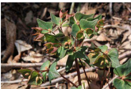
(春に咲くけど)ナツトウダイ