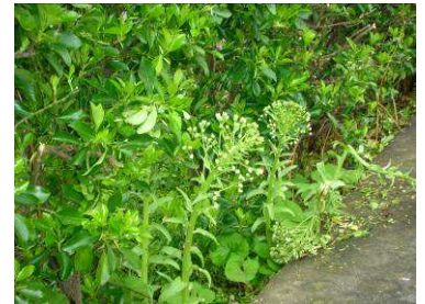
トウが立ったふきのとう