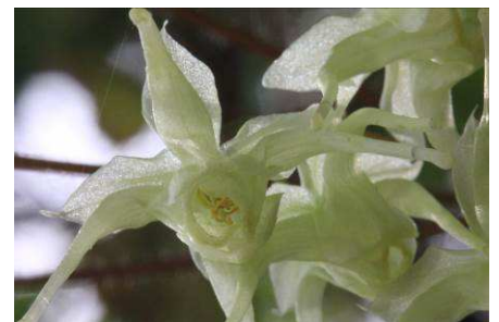
キバナイカリソウ