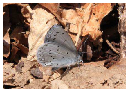
(裏羽は質素でも)ルリシジミ