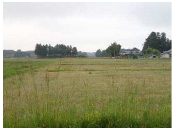
南相馬市の田んぼは雑草の原っぱと化している

なまくらな体はますますなまくらになり、これからどうなることや分からぬ。いつでもどこでもマスクが取り出せるようにしておかなければならない。(2015/06/09 記)