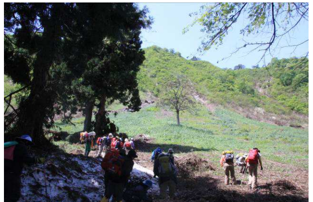
残雪周辺のスプリングエフェメラルを観察しました

今回は、中の道コースを神明沢まで延長して大森山自然公園に戻る周回コースです。この時期は三又の沢源頭からキャンプ場分岐までオトメエンゴサクの花が斜面一面に広がっているのですが、今年は生物季節が例年より一週間程度早く進んでいるため、オトメエンゴサクは花の時期を過ぎておりました。今回のメインテーマの一つにしていたイワフネタチツボスミレ群落も花を落とし、十分に観察できませんでした。しかし、キャンプ場分岐から先ではカタクリやスミレサイシン、キバナノアマナ、キバナイカリソウなどが見頃で斜平山のスプリングエフェメラルを満喫することができました。また、蝶のスプリングエフェメラルであるヒメギフチョウも姿を見せてくれ、これまでとは趣を異にした斜平山の早春の生命の息吹に接することができました。