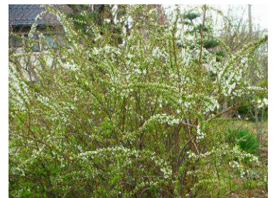
散り始めた雪やなぎ