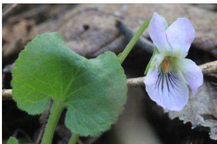
エゾアオイスミレ

私は今回、ユキツバキを見ることができ雪国のため葉が他の椿と違って柔らかい事にびっくりでした。