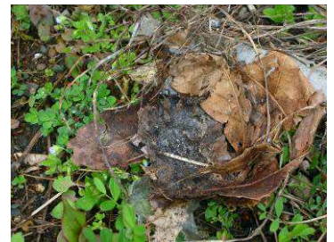
崩れたスズメの巣