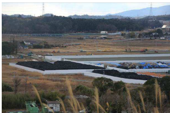
除染袋で満たされたゾーンと新規ゾーン

最近、東京でも福島でも感じるのだが、震災直後の省エネ・節電は影を潜めている。原発事故は過去のもので、今は何もなかったようにも感じる。福島の地方紙では相変わらず原発関連記事が毎日掲載されているが、中央紙にはたまに掲載される程度で、その頻度は極端に少ない。「原発事故は過去のもの」という意識こそがもっとも怖い。政治も原発は争点にならず、再稼働も易々と通る。気付けば原発事故前と何ら変わっていない状況こそが、今の政権の思うつぼだ。風化は後退だ。