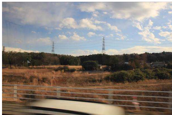
葎に覆われた常磐線と空の送電線