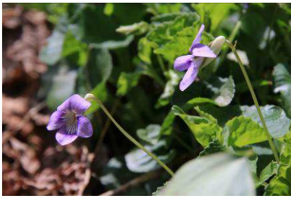
オオタチツボスマレ