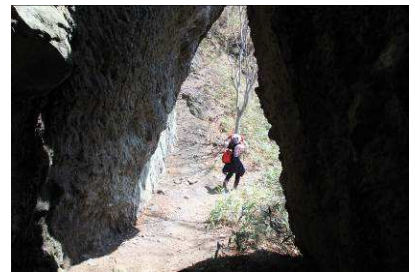
胎内をくぐって生まれ変わった？