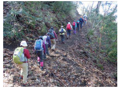
19人が並んで歩く壮観